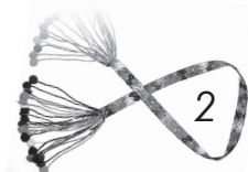
Ilustración: Mavis Herrera