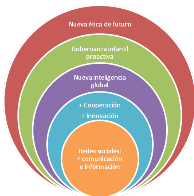
Figura I: Nuevas coordenadas de la infancia en red

A nuestro modo de ver, los nuevos ejes sociales se conforman en base a los siguientes elementos: